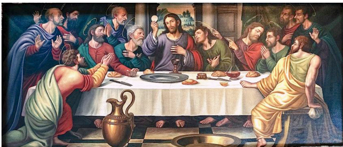
La Santa Cena (Juan de Juanes – Museo delle Belle Arti di Valencia)

Fraternità della Santissima Vergine Maria - Jesus Sacerdos et Rex